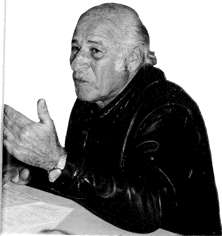
ישעיהו בן פורת

קמה קבוצה קטנה ובה חמישה שישה עתונאים צרפתיים בעלי מוניטין, והחליטה: אנחנו נוציא שבועון משלנו מבלי שבעל ממון יהיה בעל הבית. אנשי הקבוצה פנו לשני בנקים וביקשו הלוואה.