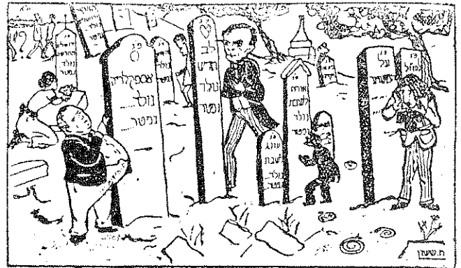
שרה הקברות של העתונות בא"י

קריקטורה משנות ה-20 - גם אז נסגרו עתונים