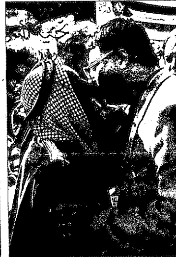
אביו של המבוקש עימד עקל (משמאל) מקבל מנהומים בביתו