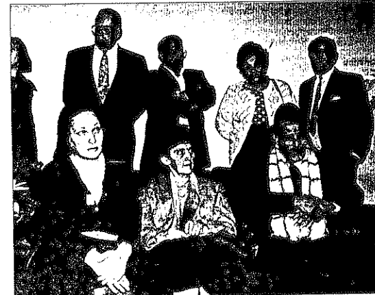
חברי השבויים והתנקרים התכנסו אתמול וזריאו לממשלה לענות לשתדלנות יוקריתם

מחבלי חמאס נעצרו בדרום לחשוני חייל (עמ' 3)